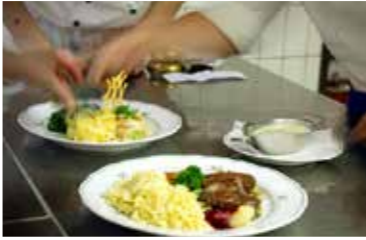
Impressionen und Angebot